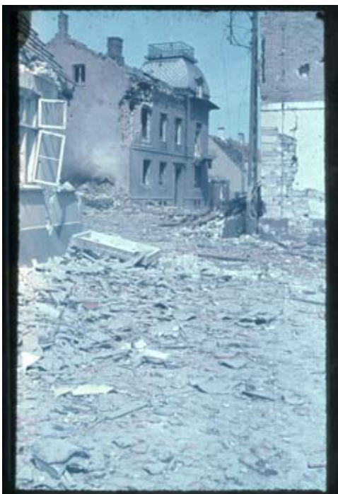
Fig. 17. Det ødelagte dommerkontor – med den intakte »kiggenborg« – set fra Havnen hen mod Nørregade. Til højre P. Bergs pakhus hvor hele kornlageret brændte. Foto måske 9. eller 10. maj – før oprydningen for alvor er sat i gang.

des, uanset at der endnu forekommer enkelte Sprængninger i Ammunitionsskibet.