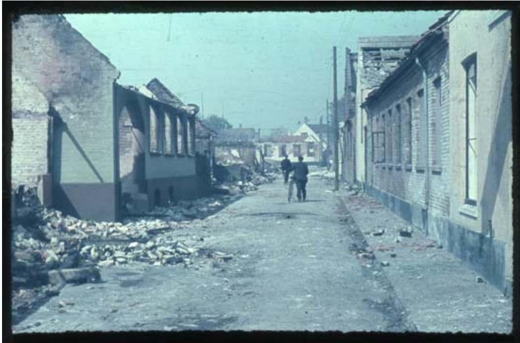
Fig. 20 og 21. Til venstre er det de helt ødelagte huse i Hjortestræde med Nexø Mejeri til højre i billedet. På billedet til højre ser man fotografen, H.H. Jensens eget hus i Nørregade, næsten overfor Hjortestræde.