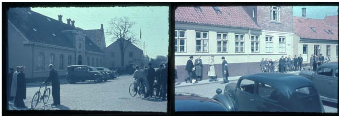
Fig. 6 og 7. Nexø Rådhus og Politistation, som fungerede som Kommandocentral (Kc) under det efterfølgende bombardement. Frihedskæmperne har biler og CB-lastbiler til rådighed for den efterfølgende internering af danske værnemagere. Modsat Rådhuset har nysgerrige samlet sig for at følge begivenhedernes gang. Ingen kunne da forestille sig, at de to bygninger, P. Berg til venstre og Gornitzkas Trykkeri til højre, ville være rygende ruinhobe i løbet af få dage.