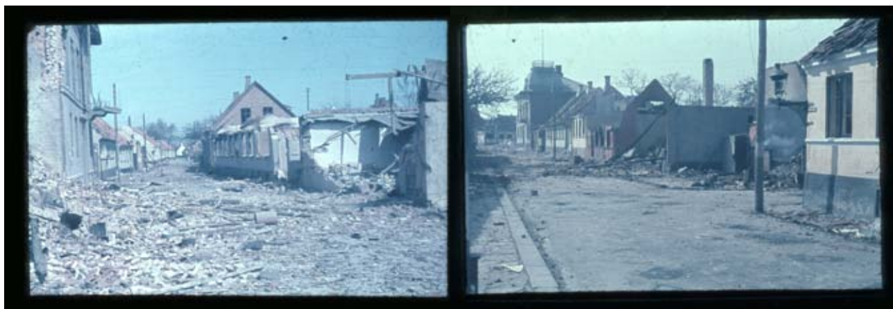
Fig. 18 og 19. Nørregade set mod nord med dommerkontoret til venstre. Til højre igen Nørregade set i modsat retning, hen mod dommerkontoret, med Hjortestræde til venstre. Fotograferet 9. el. 10. maj, gaden er endnu ikke ryddet.

Det værst ramte Omraade var Kvarteret Torvet-Aasen-Hjortestræde-Nørregade-Havnepladsen, hvor hele Karréer og et Tømmerlager stod i Flammer, men ogsaa andre Steder i Byen brændte det, saaledes Hjørnet af Brogade og Bryggeristræde, hvor Bio og 5 Beboelsesejendomme brænd-