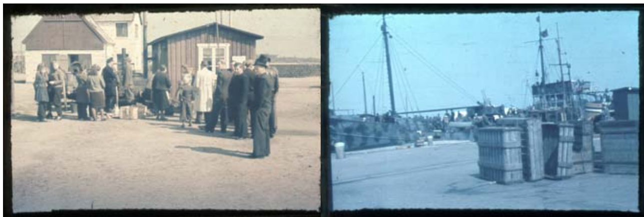
Fig. 3 og 4. En lille gruppe tyske flygtninge er samlet omkring et feltkøkken ud for Nexø Havns lodshus. Midt i billedet, ved skorstenen, ses tyske soldater, en infanterist og en marinesoldat. Yderst til højre er det formentlig nysgerrige nexøboere der skal se hvad der foregår. Til højre ankommer et tysk flygtningeskib til Nexø i begyndelsen af maj 1945.

I Slutningen af April og Begyndelsen af Maj Maaned mærkes tydeligere og tydeligere, at Krigsskuepladsen i Øst rykker Bornholm nærmere. Flygtningetransporter og oprevne Militærafdelinger, halvmilitære og civile Kolonner i overfyldte Skibe ankommer mere og mere talrigt fra det tyske Brohoved i Baltikum og fra Danzigområdet, men Skibene forbliver normalt kun kort Tid i Nexø, hvorfra de dirigeres videre til andre danske Havne, undertiden til Rønne, hvor Flygtningene udlades for senere at blive videretransporteret med Undervandsbaade og mindre Krigsskibe, medens selve Flygtningeskibene dirigeres tilbage til Indladning af nye Flygtningekontingenter.