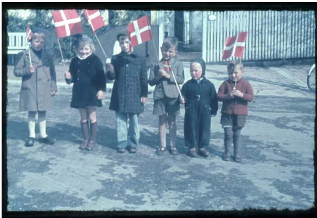
Fig. 5. Børn i Nexø fejrer befrielsen 5. maj.