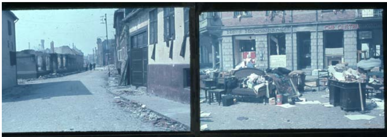
Fig. 13 og 14. Billedet til venstre er fra Strandgade med Nexøs gamle rådstue (nu museum) til venstre og Pakhusforeningen midt i billedet. Bemærk de flagrende mørklægningsgardiner. Man ser op mod Torvet og den ødelagte Sparekassebygning. Billedet til højre er fra Torvet i Nexø med Sonne-Hansen Materialhandel og til højre Chr. Glistrups slagterbutik. Ejendommen blev ramt af en bombe inde i gården, så den bagerste del af ejendom forsvandt. Derfor ryddes der ud, det er Sonne Hansens ejendele der bliver sat på gaden, skrivebordet, skoene, det nypudsede kobbertøj, maleriet af en lille pige... En buste af Chr. X og Dannebrog var ellers udstillet i butikken for at fejre befrielsen. De blev hurtigt fjernet.