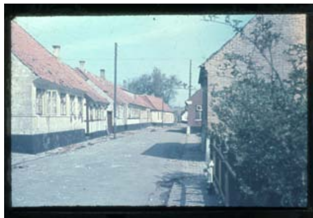
Fig. 9 og 10. På billedet til venstre ser man mod nord, op ad Nørregade med fotografen, sagfører H.H. Jensens have til højre. Jensen har også nået at løbe ned på Nordre Strandvej og fotografere det hus, der blev totalødelagt der under bombardementerne 7. maj. Man kan se på skyggerne, at begge billeder er taget meget tidligt om morgenen 8. maj. Kl. 8.30 var evakueringen af Nexø afsluttet.

Kl. 0330 modtog Kc. Underretning fra Kc. i Rønne, at Rønne By skulde evakueres ved Daggry, og Evakueringen skulde være tilendebragt inden Kl. 0900. Man